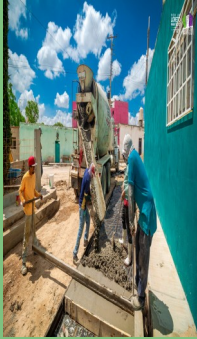
PAVIMENTACIÓN EN LA CALLE 5 DE MAYO EN LA CONCEPCIÓN, LORETO