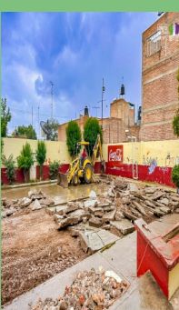
CONSTRUCCIÓN DE CANCHA DE USOS MÚLTIPLES EN EL JARDÍN DEL SANTO NIÑO EN LA COLONIA VEGA