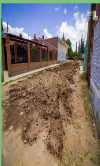
PAVIMENTACIÓN DE LA CALLE J. ISABEL ROBLES, CIUDAD