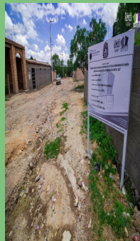
CONSTRUCCIÓN DE DRENAJE EN SANTA MARÍA