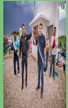
EQUIPAMIENTO DE POZO DE AGUA POTABLE EN LINARES