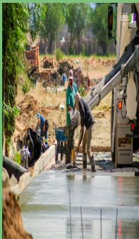
PAVIMENTACIÓN DE LA CALLE JOSE MA. CORELLA, CIUDAD