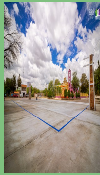
CONSTRUCCIÓN CANCHA EN SAN BLAS