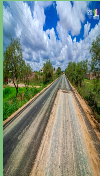
PAVIMENTACIÓN EN LA COMUNIDAD DE EJIDO HIDALGO