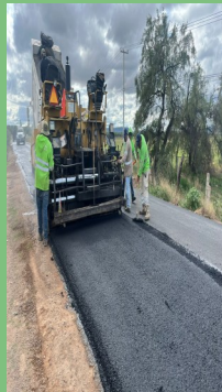
REPARACIÓN DE TRAMO CARRETERO LA VENTA-NORIAS DEL BORREGO