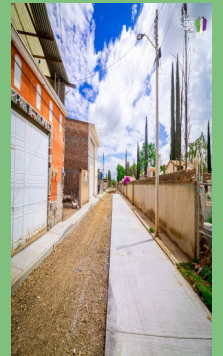
PAVIMENTACIÓN EN CALLE CONSTITUCIÓN DE 1917, LORETO