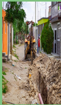
INICIA OBRA DE DRENAJE EN LA COMUNIDAD DE EL LOBO, LORETO