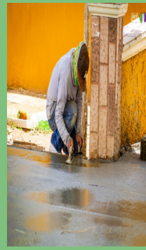
CONSTRUCCIÓN CANCHA EN ESCUELA PRIMARIA EN LA LOMA